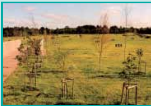
Blick über die Kriegsgräberstätte

Rund 400 Bäume mahnen zum Frieden und erinnern an die Gefallenen