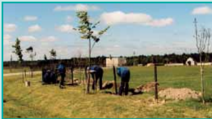
Eine Friedensallee führt an der Kirche vorbei zur Kriegsgräberstätte

Kirche Mariä Himmelfahrt mit einem Friedensbaum im Vordergrund