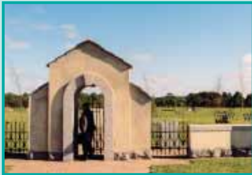
Eingang der Kriegsgräberstätte

Namensplatten stehen links und rechts am Weg zum Hochkreuz