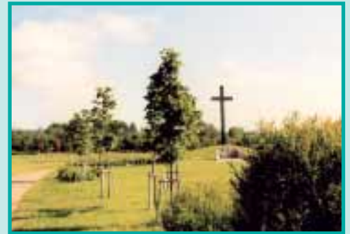
Blick zum Hochkreuz