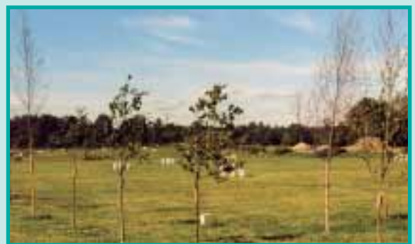
Baumgruppen und einzelne Friedensbäume stehen an den Gräberfeldern